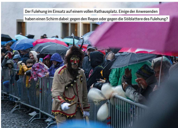
Der Fulehung im Einsatz auf einem vollen Rathausplatz. Einige der Anwesenden haben einen Schirm dabei: gegen den Regen oder gegen die Söiblattere des Fulehung?