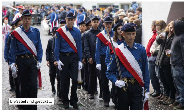
Die Säbel sind gezückt ...