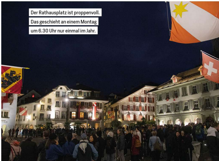
Der Rathausplatz ist proppenvoll. Das geschieht an einem Montag um 6.30 Uhr nur einmal im Jahr.

Nr. 203460, online seit: 26. September – 19.02 Uhr