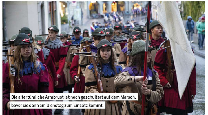
Die altertümliche Armbrust ist noch geschulter auf dem Marsch, bevor sie dann am Dienstag zum Einsatz kommt.