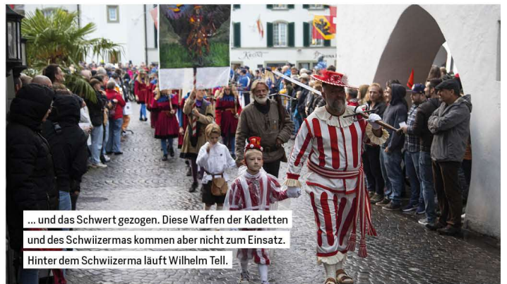
... und das Schwert gezogen. Diese Waffen der Kadetten und des Schwiizermas kommen aber nicht zum Einsatz. Hinter dem Schwiizerma läuft Wilhelm Tell.