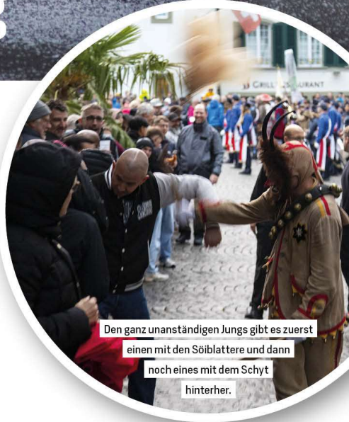
Den ganz unanständigen Jungs gibt es zuerst einen mit den Säblattere und dann noch eines mit dem Schyt hinterher.

Der Thuner Tradition des Ausschiesset kann endlich wieder mit einem Volksfest in der Innenstadt gefrönt werden. Für die Kadetten ist es der Höhepunkt des Jahres, mit Fahnenübergabe, Marschmusik, Schiessanlässen und, besonders für die ehemaligen Kadetten, ausgelassenem Feiern. Kinder, welche keine Kadetten sind, kennen das Ausschiesset vor allem wegen einer Kultfigur: dem Thuner Fulehung. Wir konnten den Narren mit der Maske fragen, wie er das Ausschiesset erlebt.