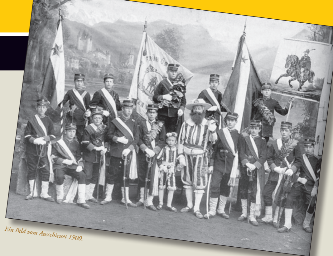
Ein Bild vom Ausschiesset 1900.

Das Thuner Kadettenkorps ist heute fest in der Bevölkerung verwurzelt. Das beweist der jeweilige Grossaufmarsch am Ausschiesset oder an den Kadettentagen. Auch der Stadtrat hat 1982 bewiesen, dass er dem Korps positiv gegenüber steht: Mit der Annahme eines «Reglements über das Kadettenkorps Thun» hat er dieses auf eine rechtliche Basis gestellt. Heute ist das Kadettenkorps eine öffentliche Einrichtung der Stadt Thun, welche allen Knaben und Mädchen vom 11. bis zum 16. Altersjahr offensteht. Zum jetzigen Zeitpunkt gehören dem Korps 350 Kadetten an, davon sind 190 Mädchen.