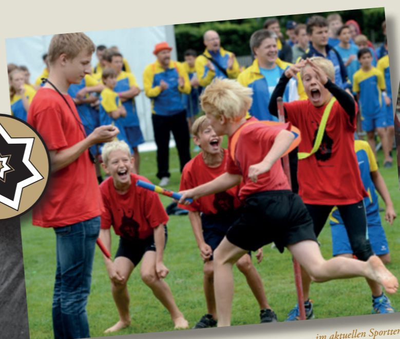
...im aktuellen Sporttunee