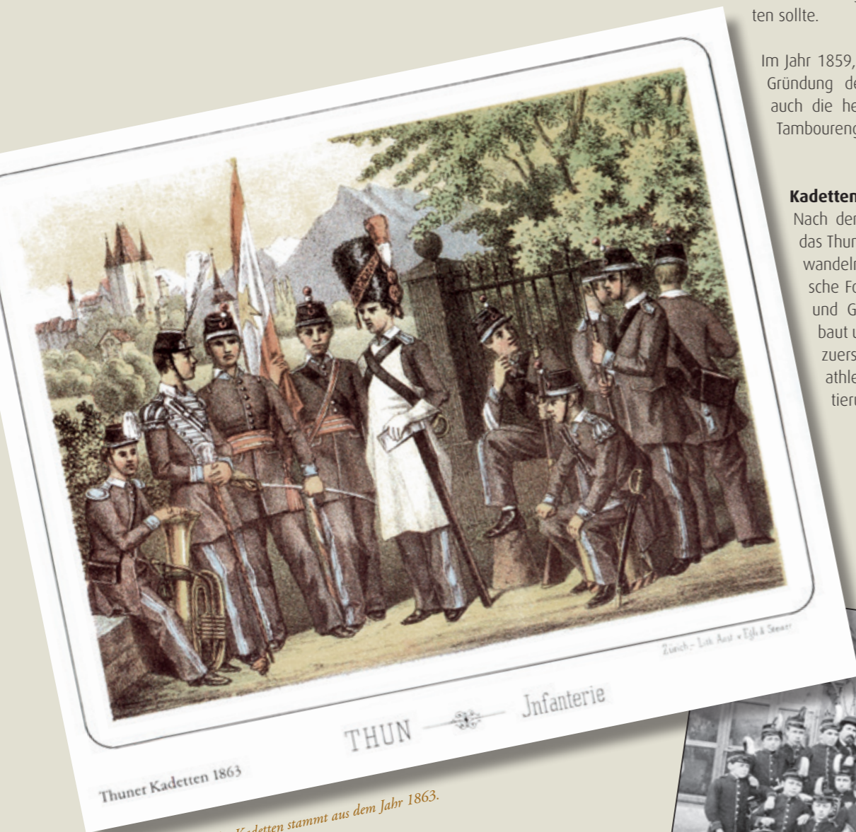
Thuner Kadetten 1863