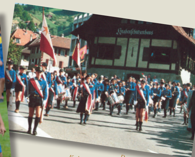
Das waren noch Zeiten: Kadetten mit kurzen Hosen und Kadettinnen mit Jupes und Béréts.