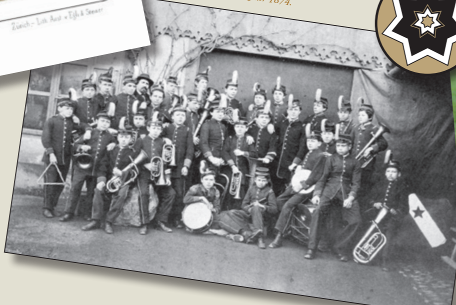
Die Kadettenmusik im Jahr 1874.